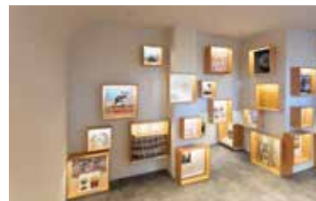
② 2階より1階ラウンジを望む