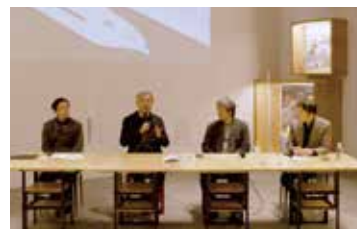
⑥ レクチャーの様子