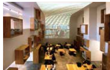
⑤ 2階より1階ラウンジを望む